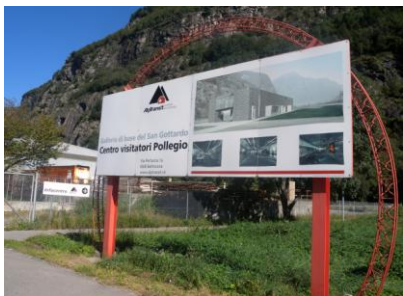
Tableau d'affichage Infocentro 13/ 09/11

Je suis ravi de vous inviter à notre excursion d'automne au Tessin, de vous inviter à visiter l'endroit où se trouve le portail sud du plus long tunnel ferroviaire du monde avec ses 57 km. Nous pensions pouvoir vous montrer la technique ferroviaire mais, malheureusement, les visites sont limitées et n'ont pas lieu en fin de semaine. Cependant, l'Infocentre Alp Transit Pollegio nous ouvre ses portes et nous dévoilera son intérieur riche en informations intéressantes de tous genres. D'ores et déjà, je me réjouis de vous voir nombreux à cette excursion.