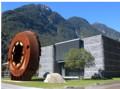
Centro avec molette de coupe de tunnelier